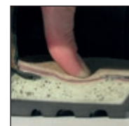
HAIX® MSL System