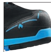
HAIX® Composite Toe Cap