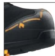
HAIX® Composite Toe Cap