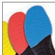
Vario Wide Fit System